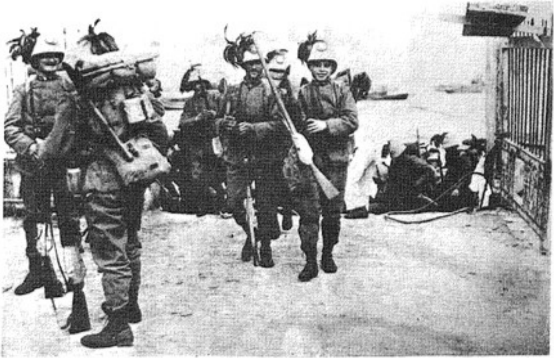
نزول قوات البرسالييري

(كلاب الصيد البحري) تمخر المياه في كل اتجاه.